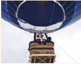
1泊研修旅行先で「熱気球係留体験」をしました。けっこう冒険しています。

毎年秋の恒例行事「会員日帰りバス研修」では県内の観光を楽しんでいます。昨年は横手市にバスで出掛け、かまくら