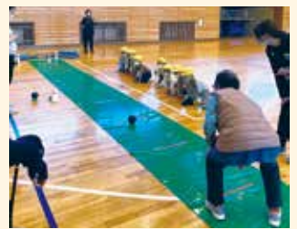
園児が見守る中、張り切って投球！

昨年は大雄交流研修館で令和4年度表彰式並びに研修会を開催することが出来、充実した1年でした。本年もコロナに負けず、活動してまいります。