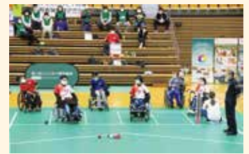
タイ王国のチームを間近で観戦したポッチャ交流会「はちくんオープン」