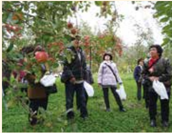
りんごもぎ取り体験は、いつも欲張り張っちゃいますね。農園の方にはいつも大変お世話になっています。

「地域世話人合同研修会」(別名「新年会」)で世話人の皆さんを労ったり、「能代山本地区障害者スポーツ教室(フライングディスク競技)」に参加したりと、地域とのつながりを大切に活動しています。