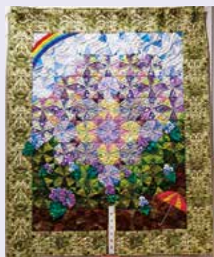
(上段右から時計回りに) 秋田県知事賞「紡ぐ日々、つながる季節」、「パッチワーク」、「プライドツリー」、秋田県身体障害者福祉協会会長賞「ささのこの竹あかり」