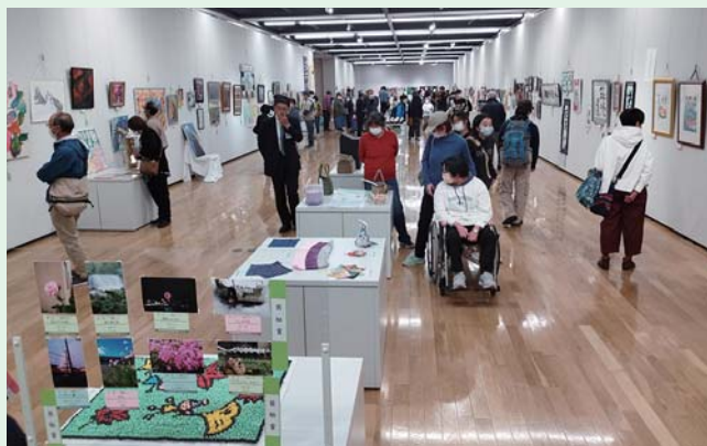
力作をじっくり鑑賞する来場者

また、お菓子やパン、布小物、アクセサリーなど福祉事業所の製品販売を行う「いきいきマルシェ♪」も連日大盛況でした。