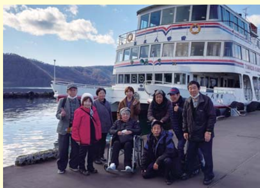
晴天に恵まれた研修旅行

昨年は、「心いきいき芸術・文化祭」を観覧した後、初めて秋田ワークセンターの視察に行きました。前から能代の協会の方が入所していると聞いていましたが、行ってみたら久方ぶりの会員との再会に皆さん感激し、しばしの交流に心が温まりました。