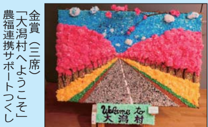
金賞（三席） 「大瀧村へようこそ」 農福連携サポートつくし