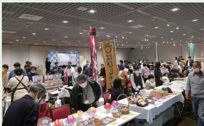
多くの事業所が出店した「いきいきマルシェ」