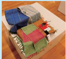
金賞（三席） 「さそりの反物」二田つくし苑一