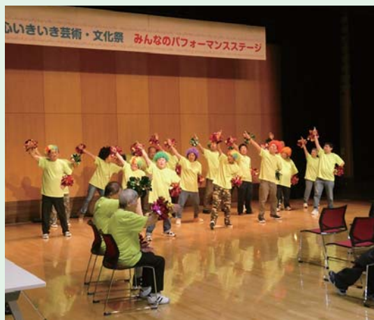
特定非営利活動法人はまなす会ゆうゆうのステージ 出演者も観客も盛り上がりました！