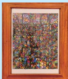
金賞（三席） 「ABC…」斎藤 努