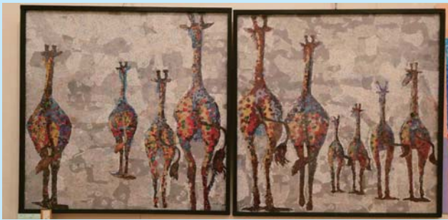
秋田県知事賞（一席）「キリン(新聞アート)」逢い共同作品