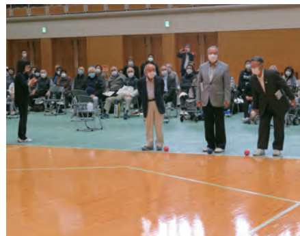
「始球式」(県立武道館)